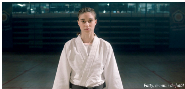
Patty, ce nume de fată!

Fazăns, o dramă romantică despre crizele existențiale ale unei femei ce trece printr-un divorț și ale unui bărbat trans care se întâlnesc în urma unei petreceri-jaf cu un final nefericit. Cu o eficiență rară – filmul are sub 90 de minute – și o capacitate și mai rară pentru a captura tandrețea, Fazâns spune o poveste caldă,