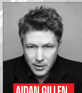
AIDAN GILLEN Actor 12:00